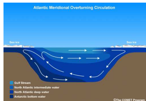
熱塩循環の模式図