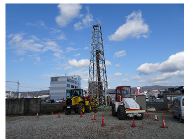
ボーリング孔によるVSP調査